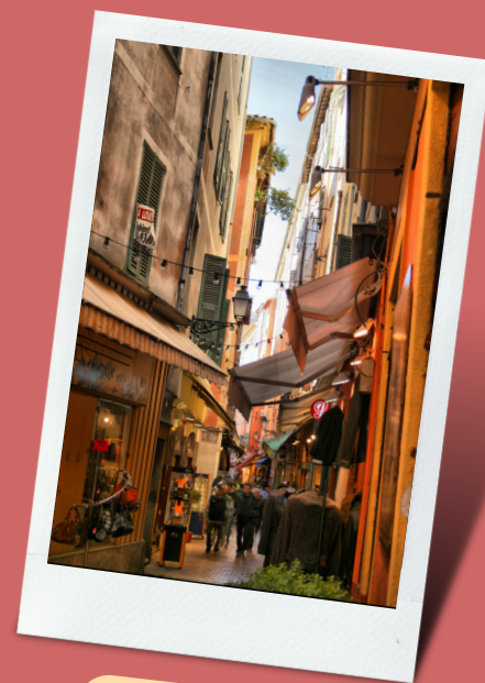
Rue commerçante Vielle Ville - Nice